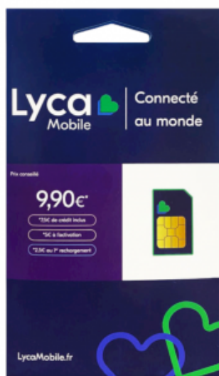
Carte SIM contenant un forfait à 9€90